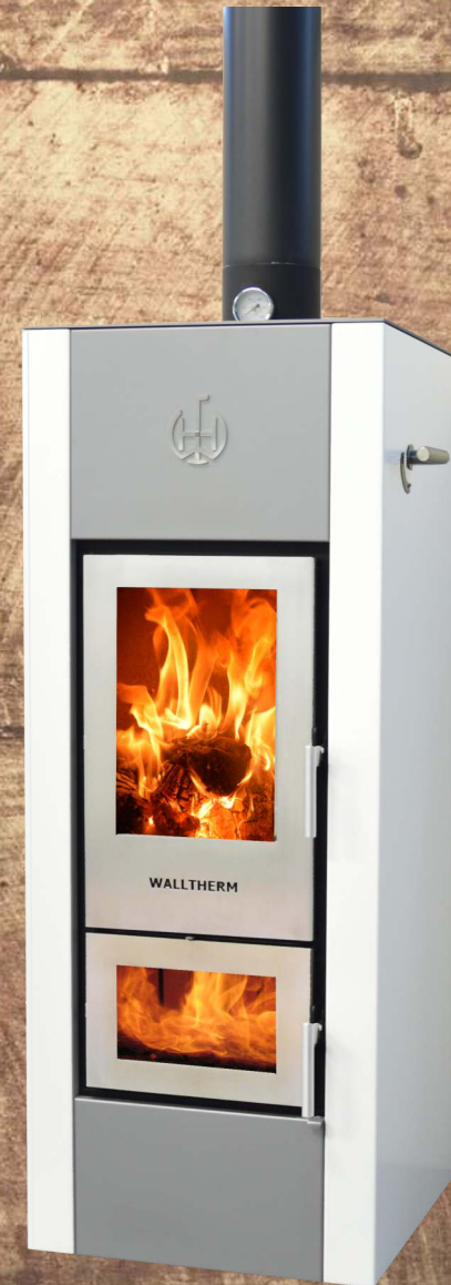
Walltherm® Vajolet weiß - silber - weiß