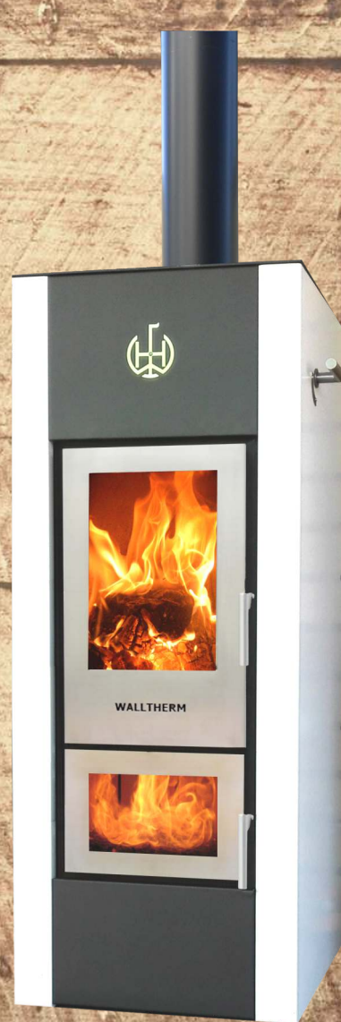
Walltherm® Vajolet weiß - schwarz - weiß

Außen ist der Walltherm® Vajolet nahezu komplett wasserummantelt. Angenehme Strahlungswärme und bis zu 80% wasserseitige Wärmeabgabe an die Zentralheizung, qualifizieren den Walltherm® Vajolet sowohl für den Altbau als auch speziell für den Einsatz im Neubau.